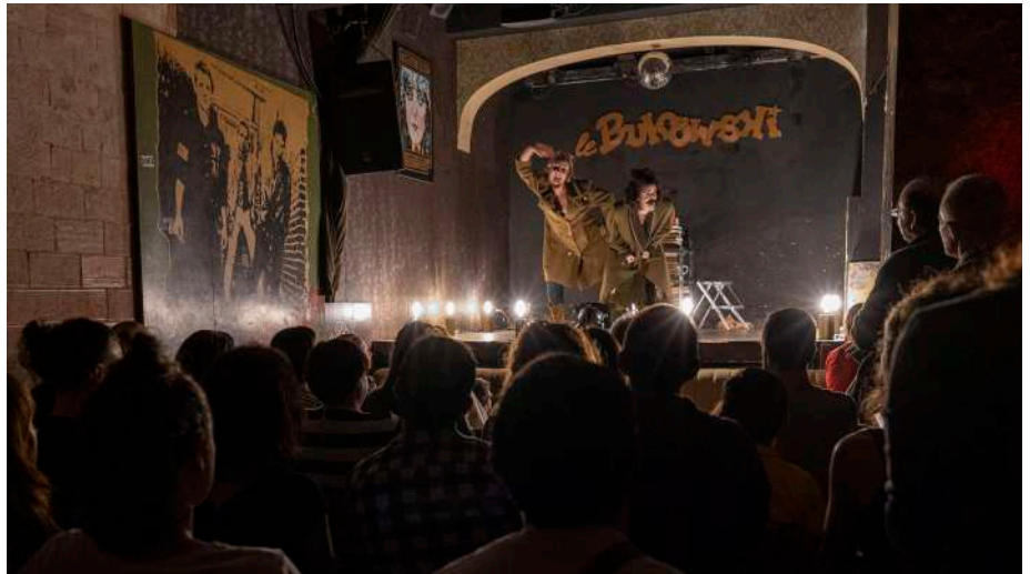
Ttak Teatroa eta Kamimaz Kolektiboa. Matriuska antzezlanara.

Poltsiko Antzerki jaialdian, eta oro har formatu txikiko antzerkian euskarazko eskaintza urria ikusita, euskarazko sorkuntzak bultzatu nahi ditugu deialdi honekin. Sorkuntzarako diru-laguntzaz gain, ekoizpenean eta hedapenean laguntza ere jasotzen dute proiektu sarituek, aukeratutako proiektuekin emanaldiak ere antolatuz. Beraz, deialdiaren laguntzak kultur katearen atal guztiak hartzen ditu barnean: sorkuntza, ekoizpena eta hedapena.