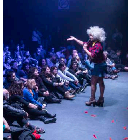
Poltsiko Antzerkia: The Chanclettes.

Hori horrela izanda, irailean 2020-21 ikasturterako matrikulazio zabaldu zen lehen hiruhilabeterako, 340 ikastaroz osatutako eskaintza anitzarekin. Osasun kisiak jarraitu arren , nabarmentzekoa da ia 190 ikastaro osatu zirela 2.700 ikasle baino gehiagorekin . Aipatu behar dugu 2020an hasitako ikastaro gehienek jarraipena izango dutela 2021 ikasturteko bigarren hiruhilekoan eta ikastaro berri gehiago izango direla uda bitartean.