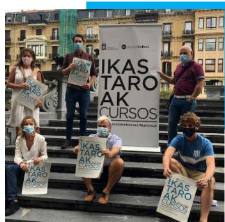
2020-2021 Ikastaroen aurkezpena.

Antzerkiak, zinemak, musikak, ikastaroek, liburutegiek, KZguneek, bilerek... Arlo horiek guztiek pairatu zituzten neurri handiagoan edo txikiagoan, pandemiak ezarritako murrizketak. Horren aurrean, Donostia Kulturarentzat lehentasuna izan zen eragile, talde eta kolektibo kulturaleri laguntzea, eta udaberrian eten edo