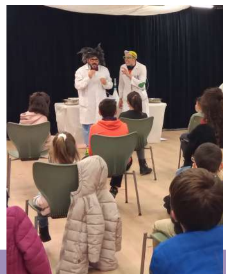
Dr Bubble & Mc Fly. Nogusano.