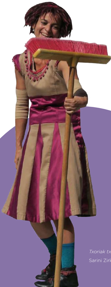
Txoriak txori. Sarini Zirko.