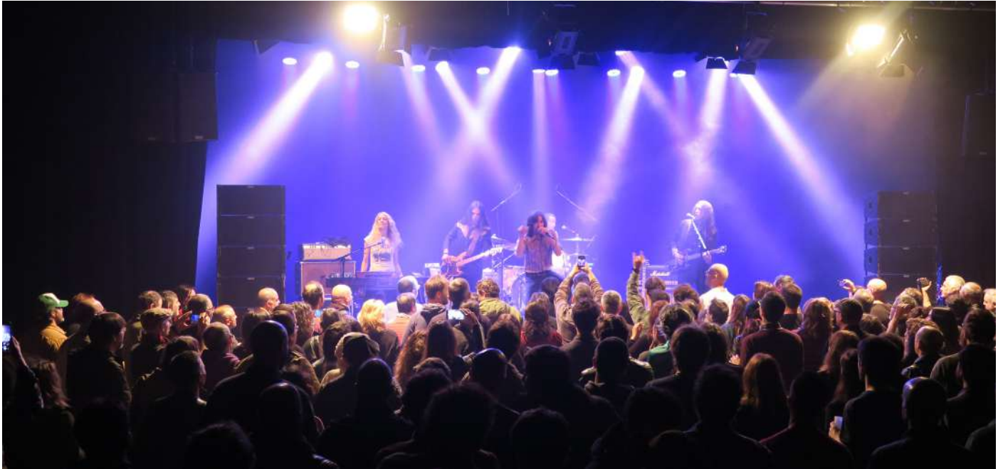
Sex Museum. Musikagela Weekend.

2 020 zatitu zuen pandemiak, “aurretik” eta “ondoren” hitz errepikakorrak bihurtu arte. 2020ko jarduna ere hala kontatu behar. 2020ko gertakizunek hitzei esanahi berria eman zieten eta gure jardueren dinamika berrasmatzera eraman gaituzte, hala ere musikak jarraitu du izaten Intxaurren Kultur Etxeko enbaxadore nagusia.