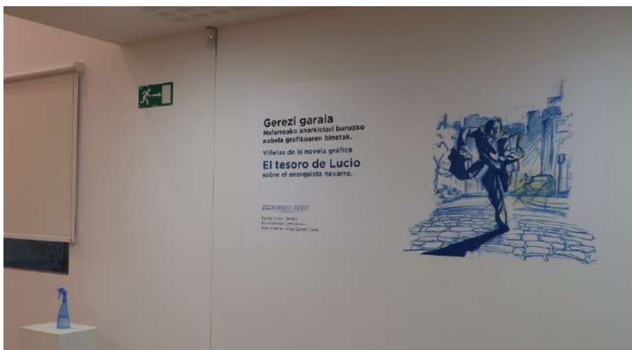
Gerezi garaia komikiaren erakusketa.