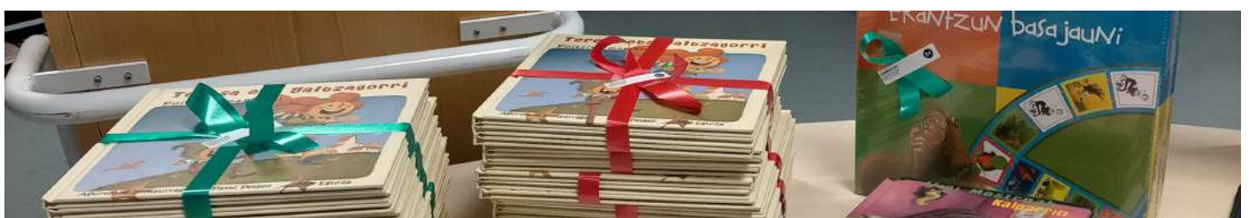
Jardueretan parte hartzeagatik, liburuak opari.