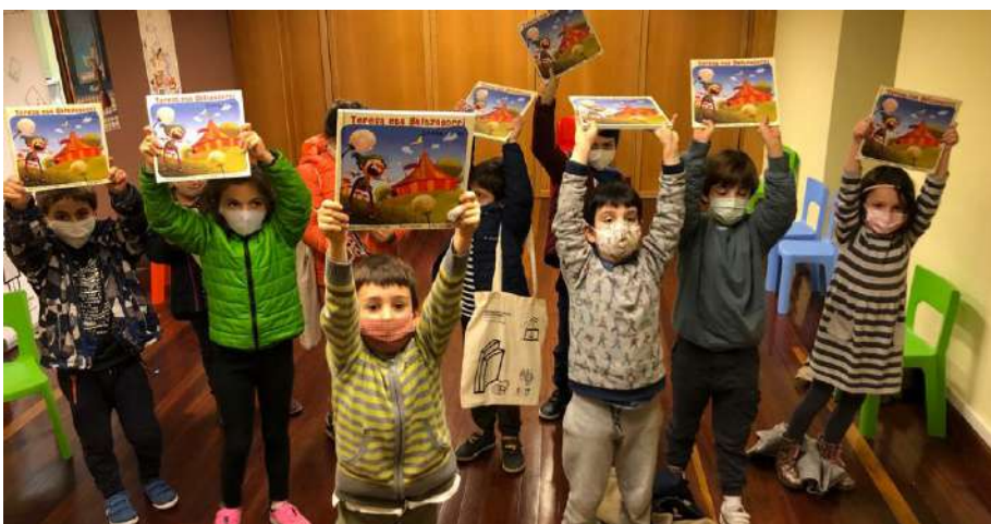
Zu irakurle, Gu kontalari.