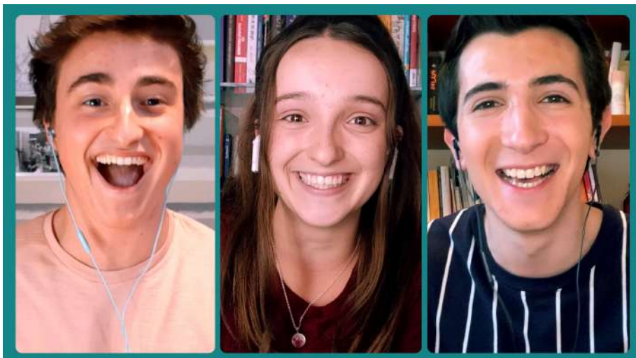
Liburu Challenge, Golazen taldearen eskutik.

Liburuzainen Elkarte arekin lankidetzan, zozketa bat antolatu genuen gure liburutegietako erabiltzaileekin. Galdera honi