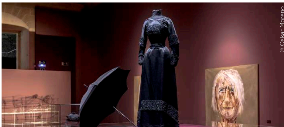
Heriotza. Ante la muerte erakusketa

Elkano Zikloa hileko hitzordu ezinbesteko bihurtu da munduaren lehen biraren eta horren ondorio historikoen ezagutzan sakontzeko, eta, bi urte geroago, ikusle asko eta asko ditu oraindik. Gainera, nabarmentzekoak dira