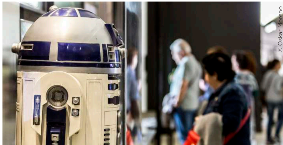
Hello Robot erakusketa

Erakusketa iraunkorrean, bitrinak kontserbatzeko eta mantentzeko lanez gainera, emaztegiaren jantzia ordezkatu da, eta haurren marinel-jantzi bat erantsi zaio Hiri-espazioa eta topaguneak atalari.