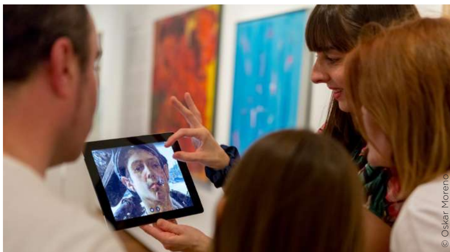
Second Canvas jarduera

Museoan aipamen berezia merezi duen lan-ildorik bada, esango genuke hauxe dela: Erronkak programazioak pentsaera kritikoa eta gogoeta bultzatzen ditu gaur egungo eztabaidagaien inguruan, eta 2019a bereziki esanguratsua izan da. Heriotza. Ante la muerte eta Hello Robot proiektuek honelako gaietan sakondu dute: heriotza, suizidioa edo eutanasia,