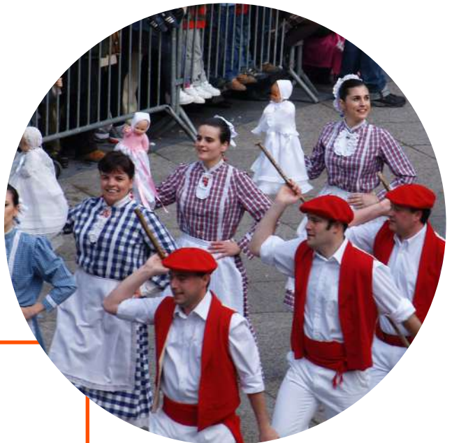
Inudeak eta artzainak