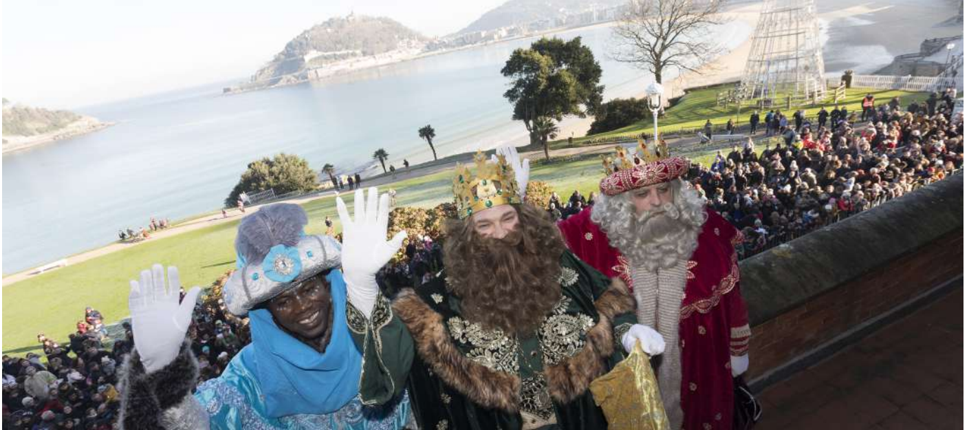
Los Reyes Magos en el Palacio Miramar

Fiestas es un departamento especial en la ciudad. Como tal, se traslada la memoria anual con el encanto y la singularidad que la temática y el trabajo necesita.