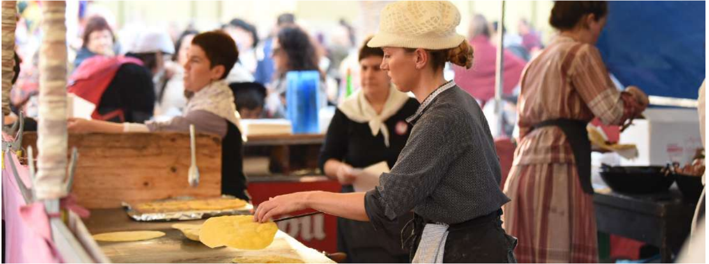
Puesto de talo en Santo Tomás