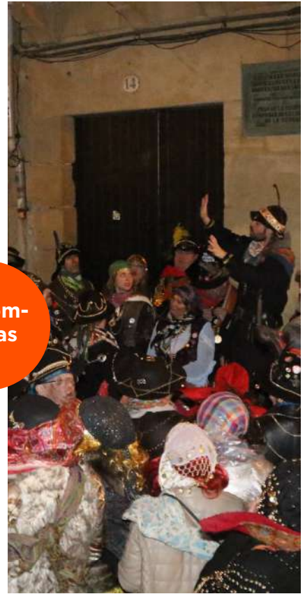
Caldereros y caldereras