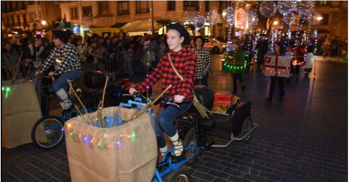
Desfile del Olentzero