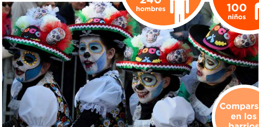
Comparsa de carnavales

Por su parte, Riberas de Loiola contó por primera vez con desfile de carnaval. Fue el sábado día 9 de marzo y participaron 16 comparsas. El resultado fue el esperado: el barrio se volcó en la celebración y solicitó que este desfile se celebrase también en próximas ediciones.