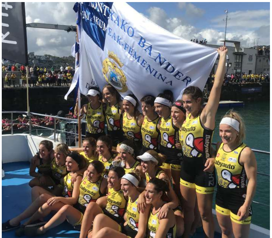
Regatas de San Sebastián: Trainera ganadora Orio - Babyauto