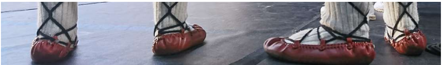
Euskal jaiak: concurso de danzas individuales

Hermanos Caballer Pirotécnicos S.L. (Castellón)