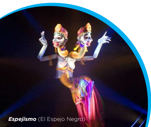
Espejismo (El Espejo Negro)

Negozio-gurpilek profesionalen arteko harremanak sustatzen eta elkar ezagutzen laguntzen dute, eta ikuskizunen edo proiektu berrien sustapenean laguntzen. Hori dela-eta, lan garrantzitsutzat daukate lankidetzarako eta merkataritzarako aukera gehiago eskaintzea.