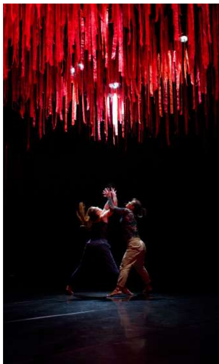
Piedra (A cielo raso)

Horiek guztiek ekarri dituzte beren ideiak edizio hau definitzeko, ahal duten guztian lagundu dute, eta Feriarekin konprometitzen jarraitzen dute baita ekonomikoki ere.