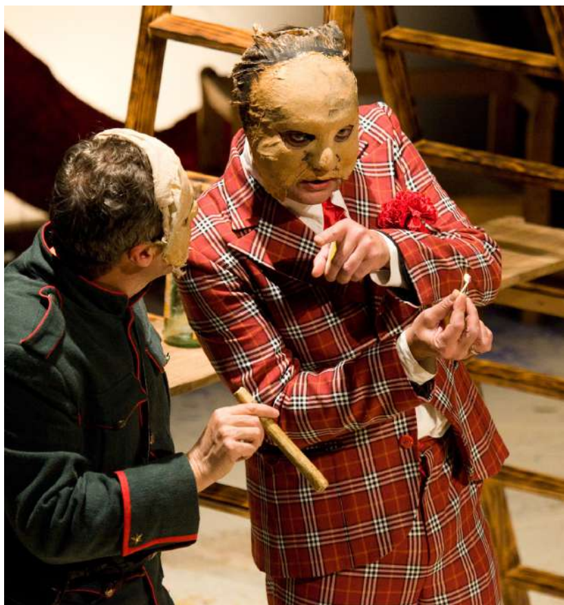
Los sueños de Don Friolera