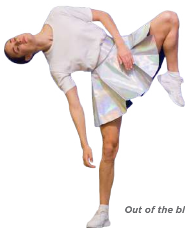
Out of the blue II (La Rutan)

2020rako, dFERIA ABROADen hirugarren edizioan, MAPASera iristea espero da, Hego Atlantikoko Arte Performatiboaren Merkatua, Tenerifen, Kanariar Uharteetan.