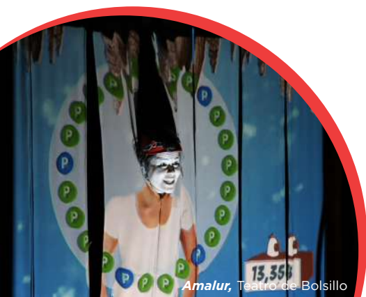
Amalur, Teatro de Bolsillo

Por todo esto, el C.C. Okendo fue lugar de encuentro y referente cultural del barrio en 2019. La afluencia de visitantes del barrio y del resto de la ciudad en general, fue continuada durante todo el año, y sus servicios y actividades mantuvieron una buena dinámica de asistentes.