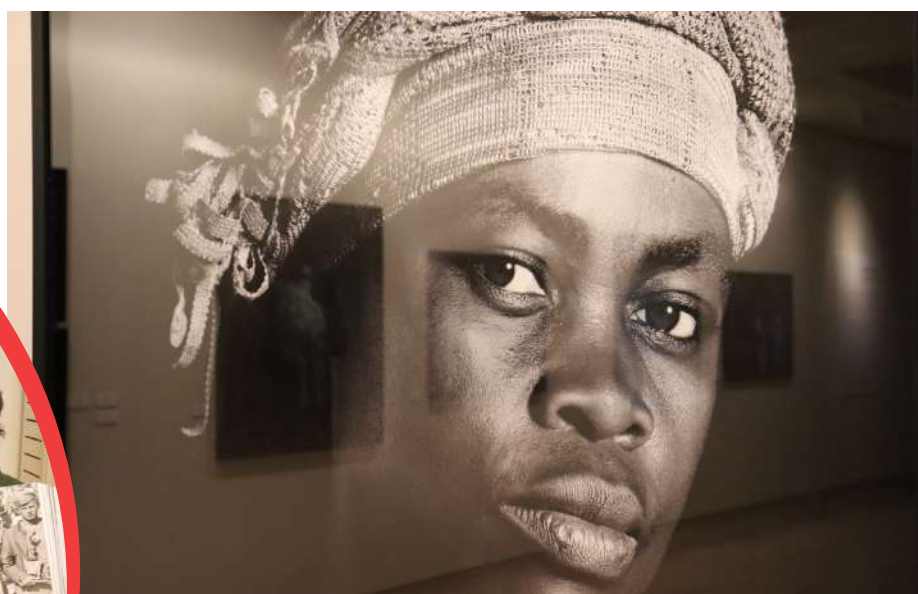
"Mujeres del Congo", exposición de Isabel Muñoz