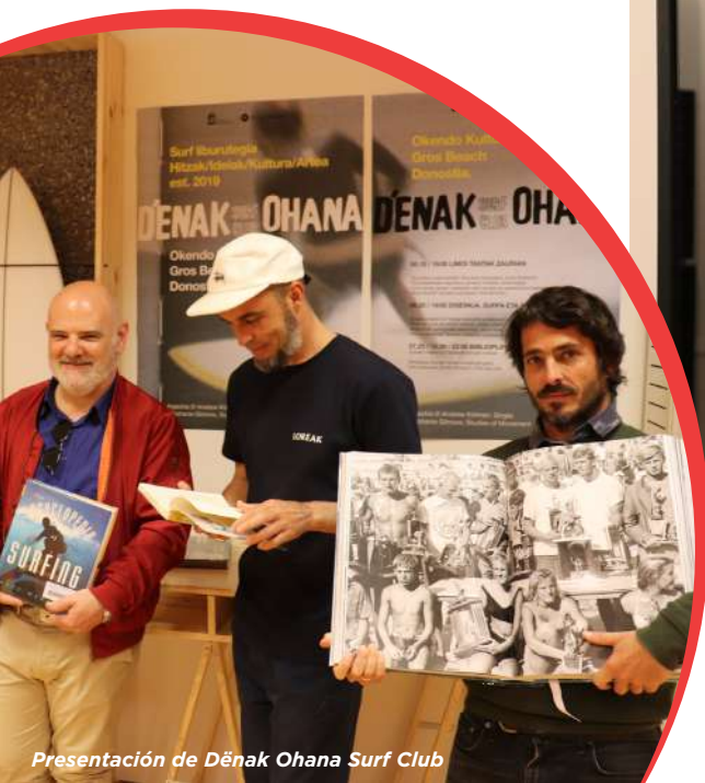
Presentación de Dēnak Ohana Surf Club

Pero si hay exposiciones que en 2019 han sorprendido, esas han sido La ciudad que perdimos , de Áncora , y El show de las pequeñas cosas , de Gilbert Legrand . Con la primera, más de 14.000 personas pudieron disfrutar no sólo de material gráfico, sino de elementos originales que formaron parte de nuestro patrimonio. Y por otro lado, El show de las pequeñas cosas fue vista por visitantes y escolares que disfrutaron del arte que se puede crear con la transformación de los objetos cotidianos.