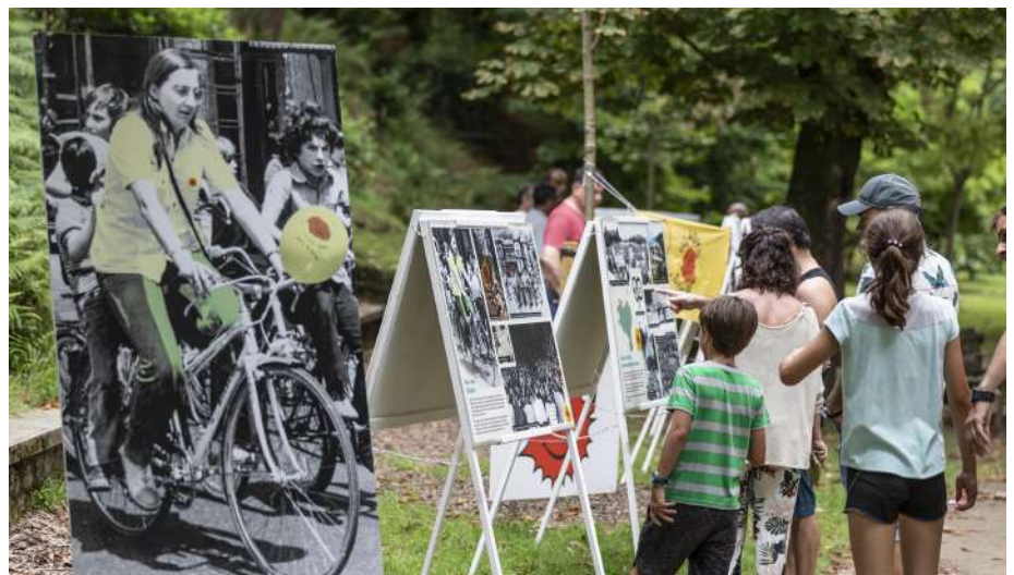
Glad is the day, actividades