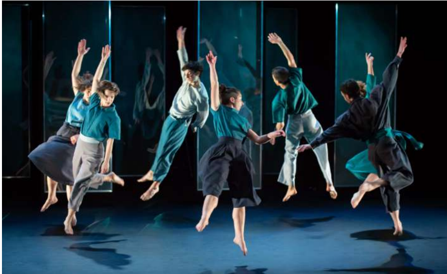
Saio zero, Bilaka Kolektiboa