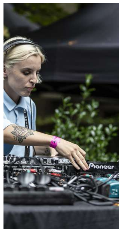
Glad is the day