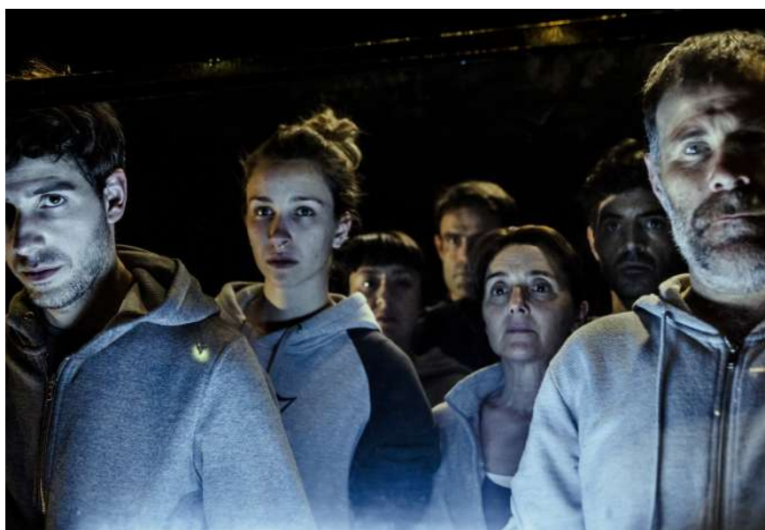
Zaldi urdina, Artedrama + Axut! + Dejabu Panpin Laborategia

Por otra parte, este año el centro participó en un proyecto musical con la banda egitarra Pelax y el apoyo y organización de Buenawista Prolection's . Se ha trabajado en la producción y la presentación de su nuevo disco, ofreciendo un concierto didáctico abierto al público y especialmente al escolar, conformando así una labor de mediación práctica y real con las ikastolas del barrio Aitor y María Reina . Este proyecto dirigido al alumnado de LH 4, 5 y 6 ha consistido en realizar un encuentro con el grupo y el personal técnico que desarrolla la actividad y así dar a conocer a los más jóvenes los aspectos anteriores de producción y elaboración de un evento musical de este tipo, previo a la misma actuación en el escenario.