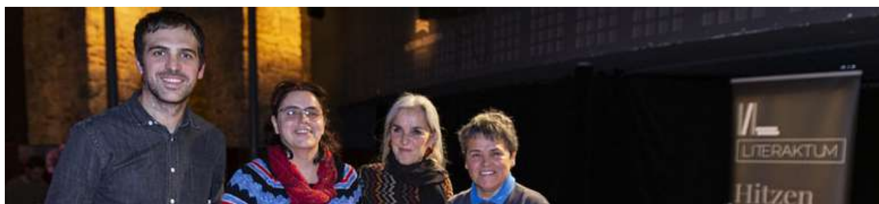
Egunero hasten delako , Literaktum mesa redonda