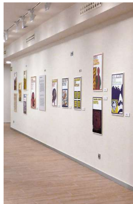
Lur exposición, Literaktum

Siguiendo el modelo de la colección Espai Catalunya , que relaciona los fondos de la biblioteca con el barrio al que pertenece, se crearon colecciones como Corner-Kirolak , colección de deportes, Motxila Txikia , colección de deportes, Mintzoan kux-kux , recomendaciones para el público infantil, y Lectura Fácil - Irakurketa erraza , para la gente que tiene dificultades de lectura.