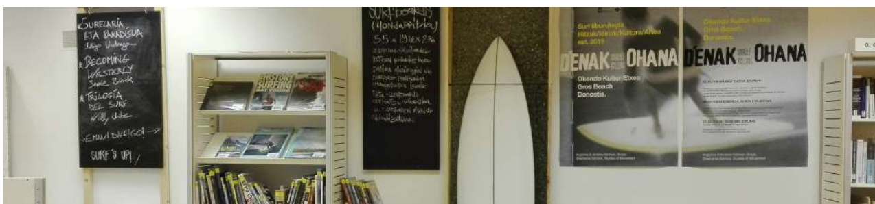
Surf txokoa, Okendo