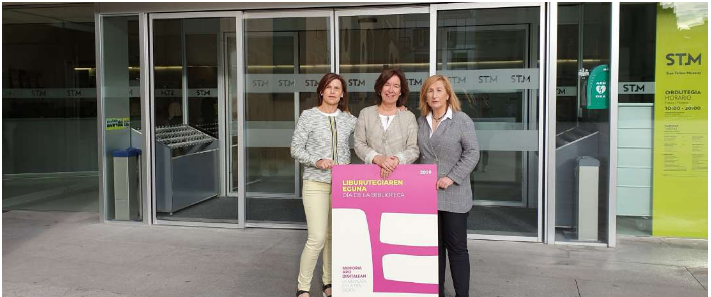
Liburutegiaren Eguna, presentación

continuó su andadura con el wikiproyecto Literatura infantil en euskera y el wikiproyecto liburuzainak. La metodología cambió y actualmente es necesaria una revisión del proyecto.