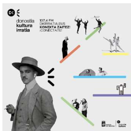
La nueva DK irratia

Un buen ejemplo es el de Museo Bikoitza , programa de intervenciones en colaboración con un/a artista invitado/a que realiza una relectura de la colección del museo. Y las más de 60 producciones propias, residencias y/o coproducciones realizadas a lo largo del año, todo ello sin contar con actuaciones, conciertos o exposiciones de creadores locales, etc. El incremento paulatino del apoyo a la creación realizado por Donostia Kultura ha hecho que lo recojamos de manera específica en esta memoria.