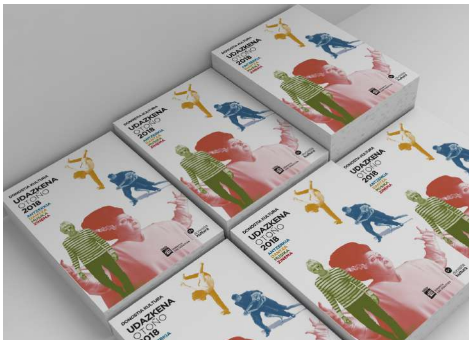
Donostia Kulturaren hiruhilabeteko agenda