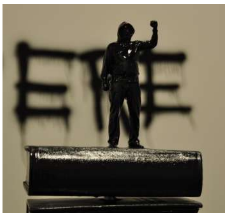
1966 | Gaur Konstelazioak | 2016

Museo San Telmori dagokionez ere, datuak oso esanguratsuak dira. 2016an, guztira 156.000 pertsonak ikusi zituzten han antolatutako erakusketak: 1966 | Gaur Konstelazioak | 2016, 1566-2016 Bake Itunak (37.000 bisitari) eta Hondar Artean , urtearen lehen erdialdean. Erakusketen hariari jarraiki, pieza berriak ekarri ziren museoko erakusketa iraunkorrari gehitzeko, eta Cristina Iglesias eskultorearen pieza bat ere jarri zen ikusgai. Udazkenean, beste bi erakusketa antolatu ziren bertan: Lucia Moholy, ehun urte geroago , eta Modernitate bakan bat , museoak berak egina. San Telmoko Udal Haur Laborategiak, berriz, Ikimilikiklik, Hoy toca Prado, En las orillas del Nilo, San Adrián, El túnel del tiempo, Haurbanistak, Azal azalean eta Jokoak saioak antolatu zituen.