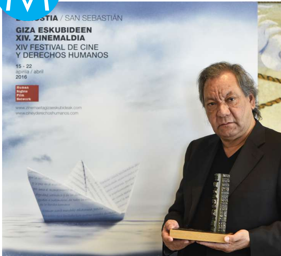
Tony Gatlif, Giza Eskubideen Saria

Zinemari dagokionez , Nosferatu zikloak Kieslowski zuzendari poloniarra eta Screwball Comedy omendu zituen iaz.