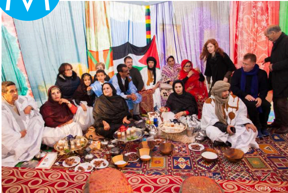
Hondar artean proiektuaren aurkezpena