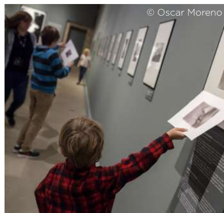
Lucia Moholy, ehun urte

Urgulleko Donostiara begira erakusketak, azkenik, 175.000 bisitari izan zituen; zenbait egunetan, 2.500 lagunetik gora ere izan ziren.