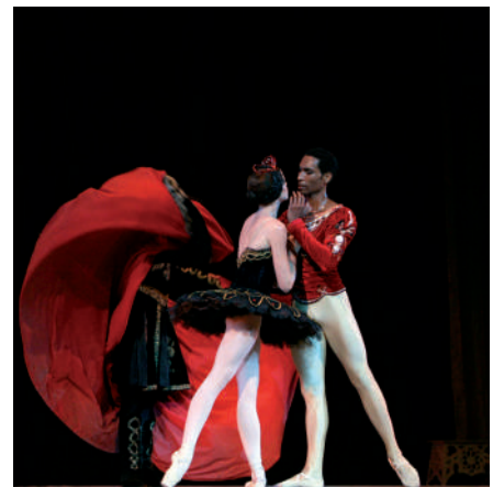
El lago de los cisnes

Musika programazioari dagokionez, Victoria Eugenia Antzokiaren kasuan hauek dira izen aipagarrietako batzuk: 2015eko izen esanguratsuetako batzuk: Pablo Milanés, Leiva, Revolver, Ismael Serrano, Dire Straits tribute