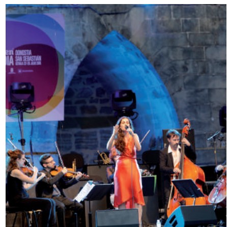
Silvia Pérez Cruz Heineken Jazzaldian