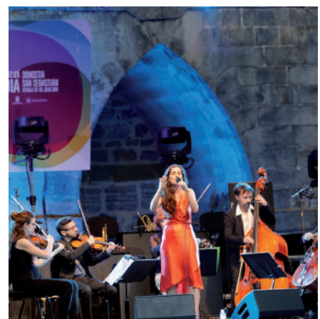
Silvia Pérez Cruz en Heineken Jazzaldia