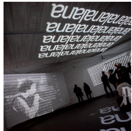
Exposición Ikimilikiliklik, El universo poético de JA Artze en el museo San Telmo