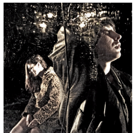
Arrastoak de Dejabu Panpin Laborategia ganó el premio Donostia Saria