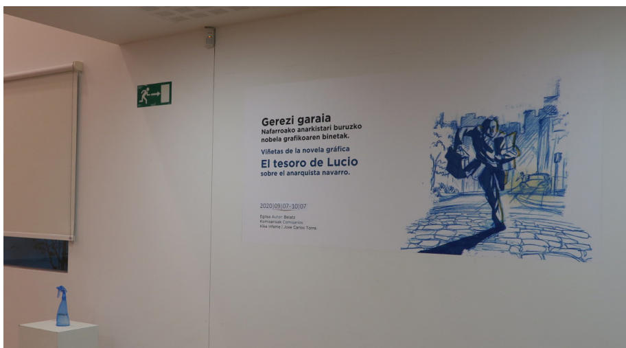
Gerezi garaia komikiaren erakusketa.