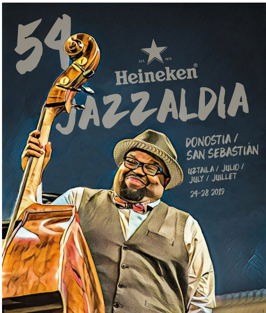
Cartel 54 edición HJ