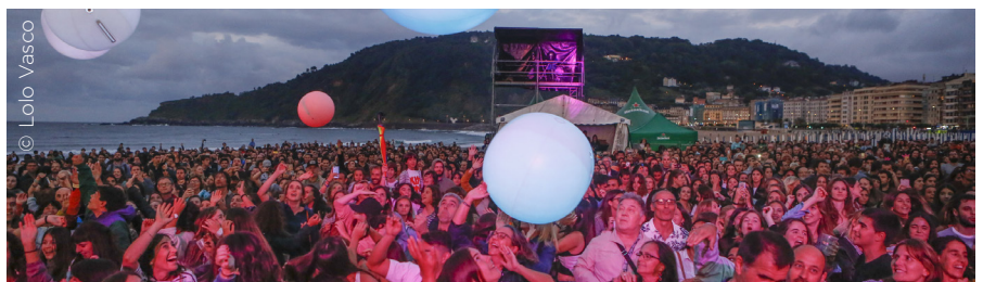
NØGEN, Escenario Verde Heineken

músicos amateurs. Los 10 grupos que tras el proceso de selección de grupos locales, han participado en el Festival, son jóvenes residentes en Euskadi, pero procedentes de hasta 8 CCAA distintas. Acuden al Centro Superior de Música del País Vasco para formarse como músicos y en este sentido, propuestas como la que les ofrece el Heineken Jazzaldia resultan de enorme importancia para comenzar su carrera profesional. Aunque se hace constar en el anexo correspondiente, hay que reseñar que la razón social como criterio de identificación de la nacionalidad de los grupos, en nuestro caso, no refleja adecuadamente lo variopinto de los orígenes de los músicos. En la mayoría de los casos se les contrata como personal de Donostia Kultura, dado que son