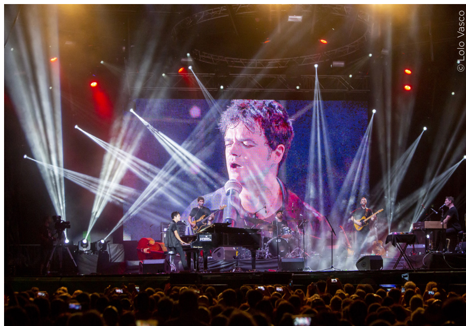
Jamie Cullum, Escenario Vede Heineken