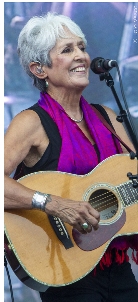
Joan Baez: Fare Thee Well... Tour 2019

Los demás escenarios tampoco descansaron. Jazz por todas partes y a todas horas. En Kutxa Kultur Kluba de Tabakalera, en el Club, en Nauticool, en el restaurante Xarma, en El Perlón, en el espacio FNAC... Un no parar.