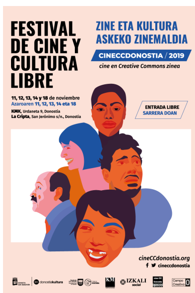
Festival de cine y cultura libre