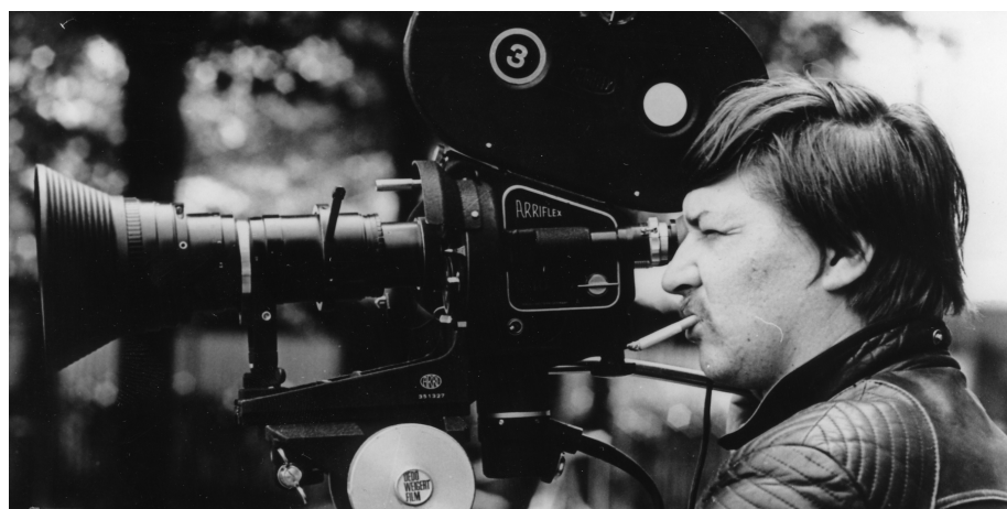
Fassbinder, ciclo Nosferatu

Otros colectivos de carácter social que han vuelto a utilizar el audiovisual como objetivo o medio de difusión de su mensaje han sido: Atzegi , la iniciativa Bideak Zabalduz , Manos ke rien , y Emakumeen Etxea (VIII Muestra