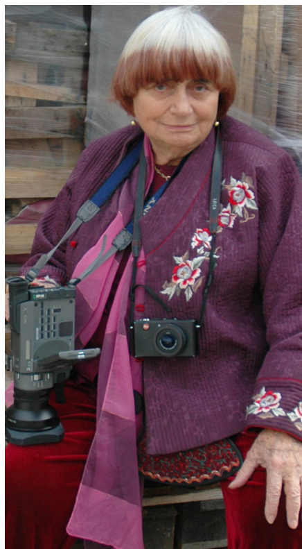
Agnès Varda, ciclo Nosferatu

Con relación directa con distintos deportes, el festival FICA volvía por segundo año con el Cine y Atletismo como lema, y SAIL IN aterrizaba por primera vez en Donostia, con su mirada al mundo de la navegación. Más consolidadas permanecen las sesiones de Cine y Montaña de Menditour . Y en Korner, kultura&futbol festibala , el cine también volvía a tener un papel significativo en su segunda edición, ofreciendo 2 grandes películas.