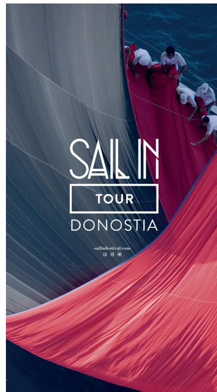
Sail in Tour

El Teatro Principal ha acogido por tercera vez la gala final del certamen Beste Begiradak , dedicada al cine amateur de diferentes colectivos, con singular atención a los más jóvenes. Este trabajo con los futuros espectadores y creadores se realiza asimismo en el programa de Euskara Zine Aretoetara conveniado con Tinko, y que acerca