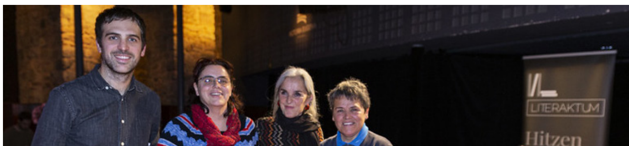
Egunero hasten delako , Literaktum mesa redonda