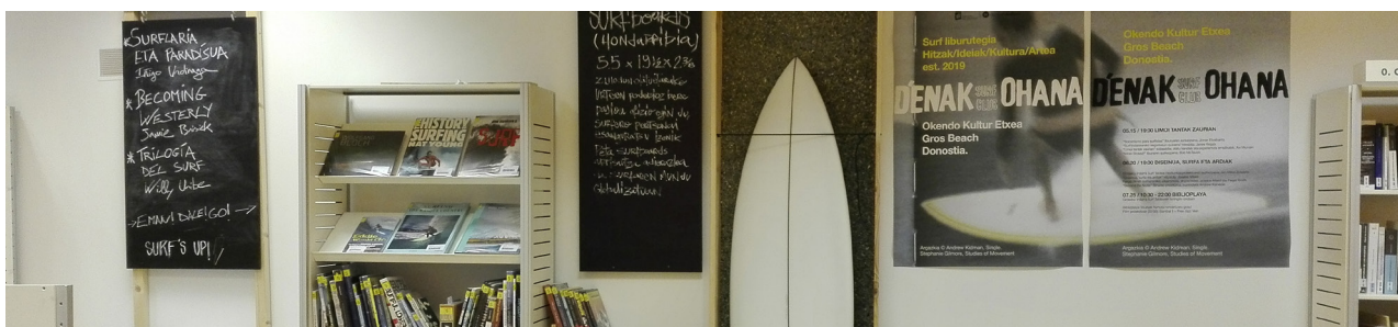
Surf txokoa, Okendo