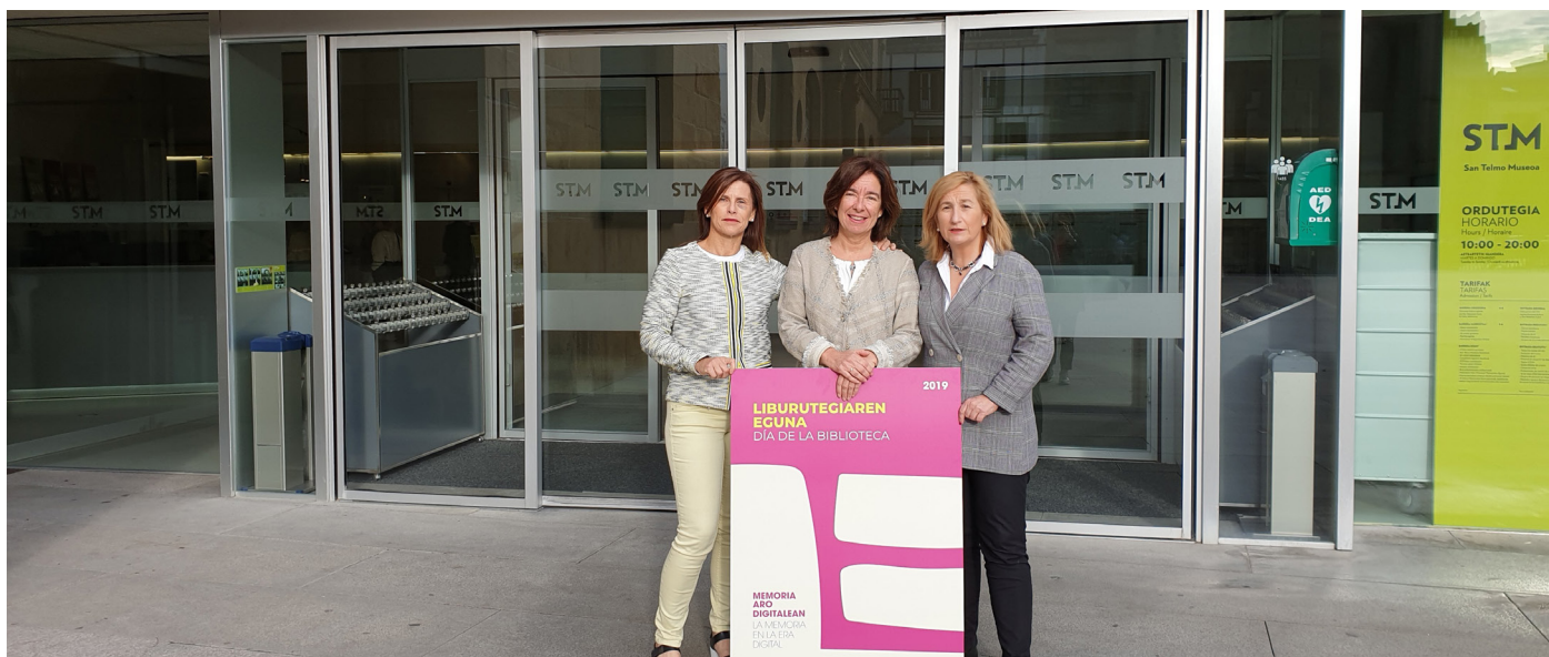
Liburutegiaren Eguna, presentación

continuó su andadura con el wikiproyecto Literatura infantil en euskera y el wikiproyecto liburuzainak . La metodología cambió y actualmente es necesaria una revisión del proyecto.