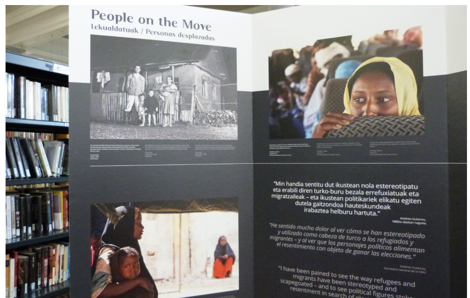
People on the Move

La creación de contenidos digitales , fundamento del programa Wikiliburutegiak ,