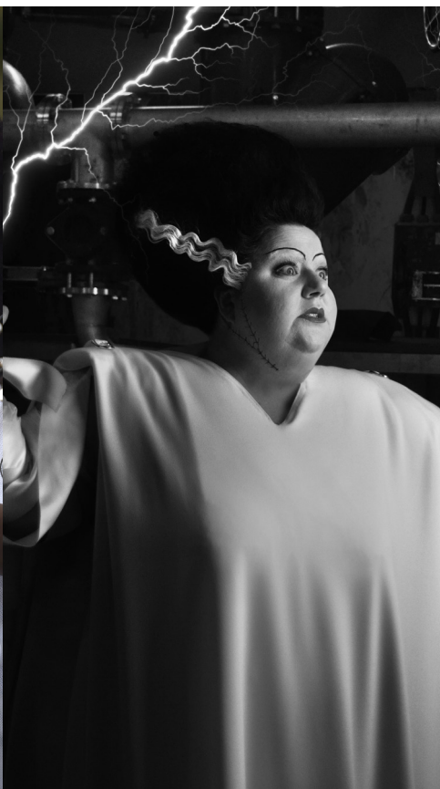
Beldurrezko Astea - Kartela