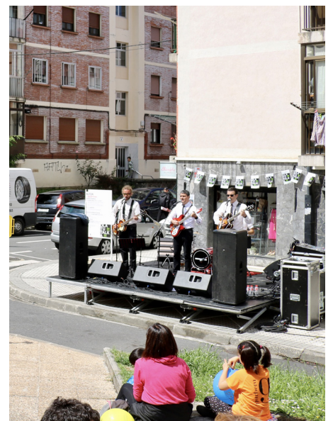
Psicoacoustic Olatu Talka jaialdian