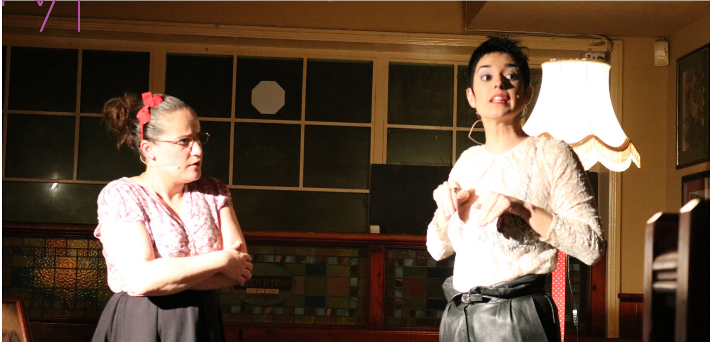
Decopivolta taldearen Tulipas antzeziana, Poltsiko Antzerki Jaialdian.