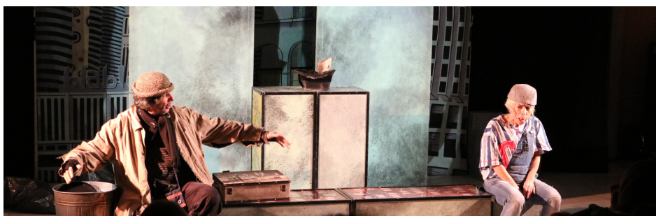
Tiral Aurrera! Panta Rhei taldearen emanaldia.

Elkarte eta entitateekin elkarlanen bidez programa garrantzitsuak eta iraunkorrak mantendu ziren urtean zehar, besteak beste, Emakumeen Astea (Ostadar, Utai Belar eta Elkartea berri), Naturaldia (AHM eta Aranzadi) edo Bertso Astea . 2017ko Naturaldia bertako narrasti eta anfibioren ingurukoa izan zen, eta Bertso Astearen barruan aipatzeko izan zen Mug Mus Laborategiaren Esku hariak Oteizaren (H)arira dantza ikuskizuna. Oroimen zehatzak ere izan ziren, Rotetako K.E.ren 50. urteurrenaren erakusketa kasu.