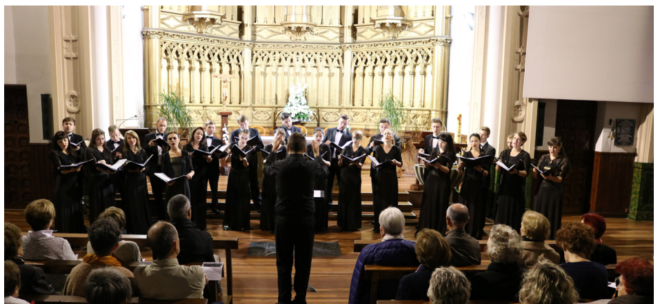
Sophia Chamber Choir

Plus 55 programak, jarduerekin eta auzoko eragileekin elkarlanean, zerbitzua sendotzen jarraitu zuen. Azken bi urteetan igoera izan zuen zuzeneko arretan eta erabiltzaileentzako zerbitzuaren erreferentzian.