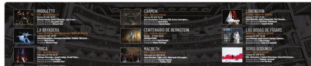
Donostia Kulturaren Twitter kontuaren irudia.