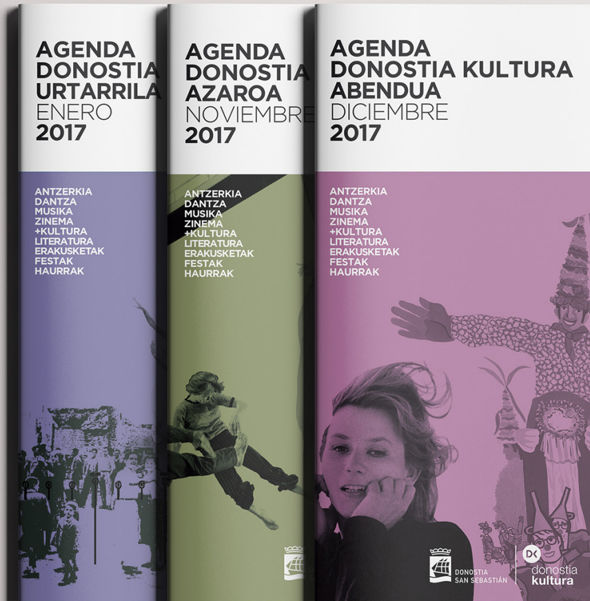
Donostia Kulturaren hileroko agenda.

Donostia Kulturaren Komunikazio eta Irudi departamentuak erakundeare irudi kohesionatua kudeatzen du, eta, bertan, beste 16 kultur marka biltzen dira (Victoria Eugenia Antzokia, San Telmo Museoa, Donostia Kultura Festak, Heineken Jazzaldia, Olatu Talka, Fantasiatzko eta Beldurrezko Zinemaren Astea, dKLUBA, Literaktum, dFERIA, Beste Hitzak-Other Words, Giza Eskubideen Zinemaldia, Musikagela, Casares Irratia, Txikijazz, Larrotxene Bideo eta Korner festibala).