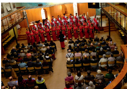
Semana Coral: Batavia Madrigal Singers