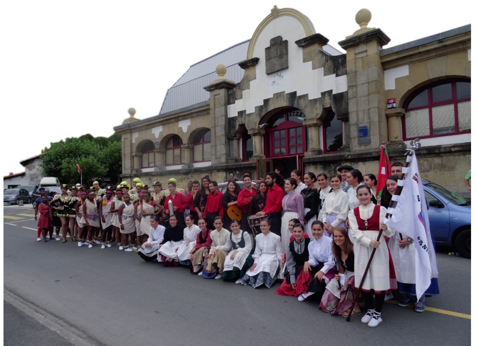
XXVIII Festival de Folklore de Loiola

Exposiciones: 5 espacios expositivos (la sala de exposiciones, el hall y los baños del Centro Cultural, el escaparate de la droguería Lekuona y Etxarriene) y un gran número de exposiciones, destacando la de arte urbano de Loiola de M-etxea , la colectiva de la Asociación Artística