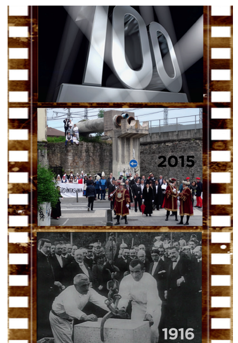
2º remake. Centenario de la colocación de la primera piedra de Ciudad Jardín