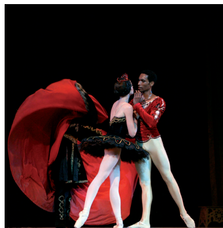
El lago de los cisnes

Musika programazioari dagokionez, Victoria Eugenia Antzokiaren kasuan hauek dira izen aipagarrietako batzuk: 2015eko izen esanguratsuetako batzuk: Pablo Milanés, Leiva, Revolver, Ismael Serrano, Dire Straits tribute