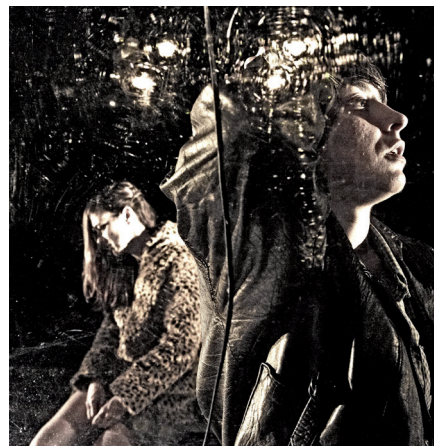
Dejabu Panpin Laborategiaren Arrastoak lanak irabazi zuen Donostia Antzerki Saria