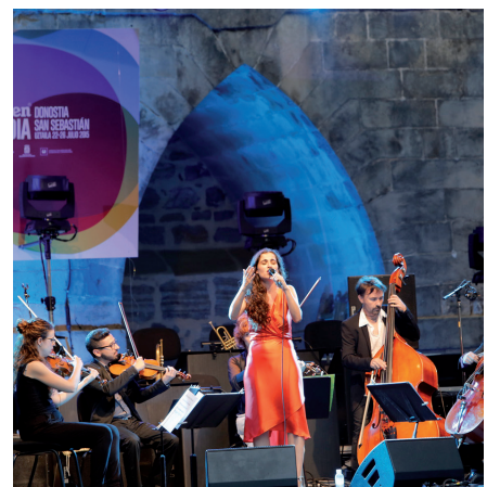
Sílvia Pérez Cruz Heineken Jazzaldian