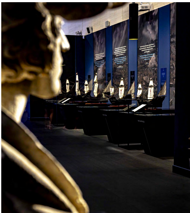
STM, Elkano

Cabe resaltar los datos positivos de venta de entradas en el primer semestre de año, con numerosos “sold out” , así como la excelente respuesta ante la programación del Jazzaldia 2021, con un 90% del aforo vendido . Son asimismo reseñables los datos de participación en los cursos que organiza Donostia Kultura. Con más de 7000 matrículas , las y los donostiarras demostraban sus ganas por recuperar la cultura de manera presencial y participativa. La exposición de Elkano durante el verano supuso otra de las buenas noticias del año, con más de 25000 visitantes volcados en la muestra, dato especialmente bueno en un sector, el de los museos, que se ha visto especialmente afectado. No así el sector literario (la lectura y el consumo de libros se ha incrementado durante esta pandemia), lo que ha dado dos buenas noticias a Donostia Kultura: Por un lado, la presencia de la ciudadanía en la red de Bibliotecas de Donostia que ha rondado los 533.000 usuarios/os, con un nivel de préstamos de 399.983 ejemplares , cifra prácticamente pre-pandémica. Y, por otro, el éxito del festival literario Literaktum , que con la asistencia de 3.500 ciudadanos demostró ser una cita cultural donostiarra al alza.