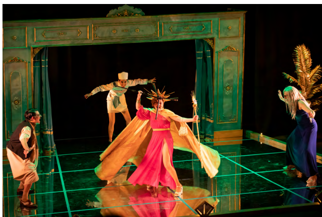
La cresta de la ola, La Estampida