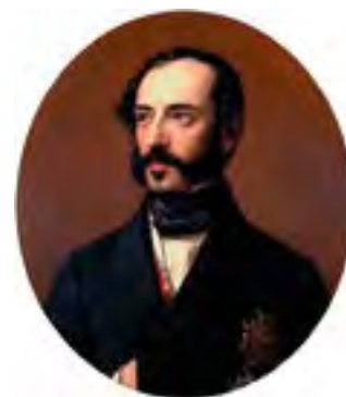
Ventura de la Vega

La historia del Teatro Español de Madrid se remonta al 21 de septiembre de 1583, momento en el que tiene lugar su primera representación. Su actividad continúa hasta el día de hoy, convirtiéndose así, en el teatro más antiguo del mundo en cuanto a representación continuada se refiere.