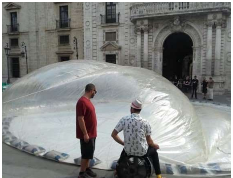
Montaje arquitectura temporal, Bienal de Sevilla.