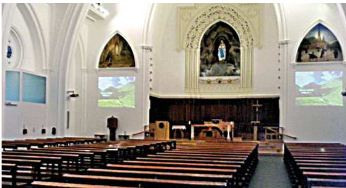
Iglesia de Nuestra Señora de Lourdes Eleiza ( San Sebastián / Donostia )