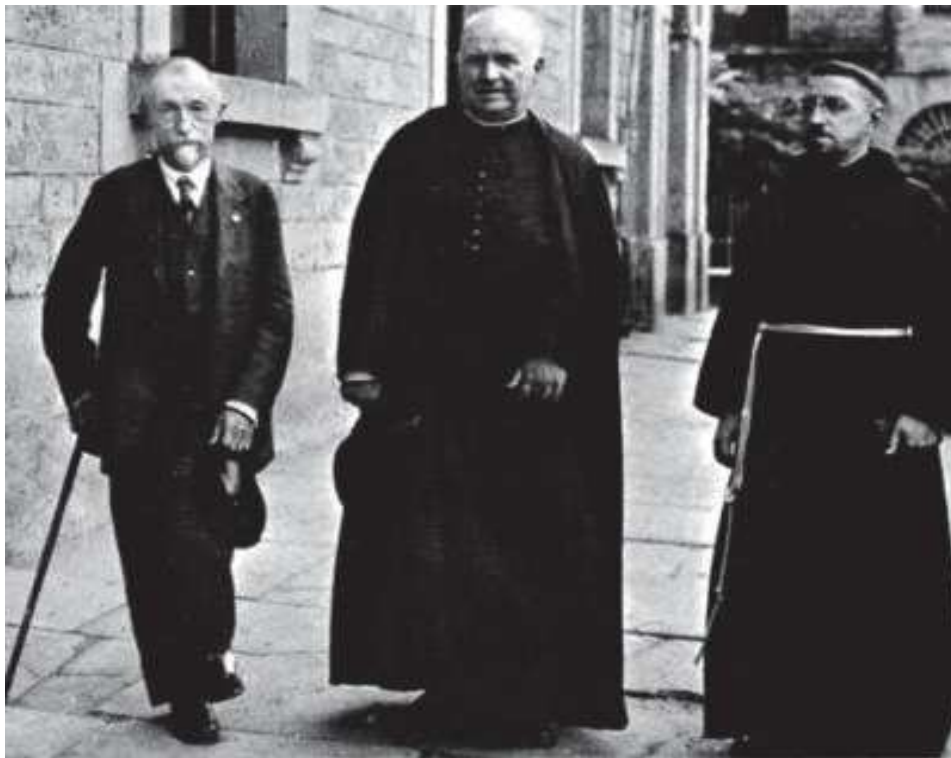
Telesforo de Aranzadi, R.M. de Azkue y el Padre Donostia