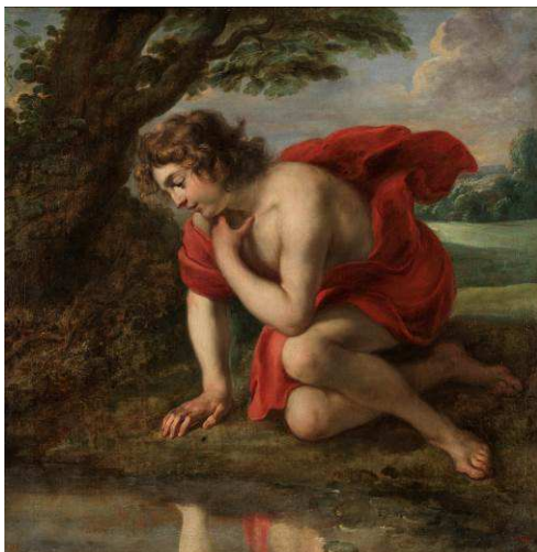
Jan Cossiers, Narciso, 1636-1638. Óleo sobre lienzo.

Uranok eta Geak edota Zeusek eta Mnemosine titanideak sortutako musak Olinpon bizi ziren, eta bertako jainkoen festetan kantan eta dantzan aritzen ziren. Betidanik Apolori lotuta agertzen ziren, arteen jainkoari lotuta alegia, eta, banaka edo taldeka, artisten inspirazio-iturritzat jotzen zituzten, bereziki idazle eta artisten inspirazio-iturritzat, hainbat arte-diziplinaren eta jakintzaren pertsonifikazioa izateraino.