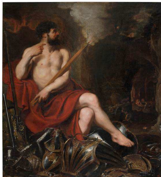
Pedro Pablo Rubens, Vulcano y el fuego , siglo XVII. Óleo sobre lienzo.

A lo largo de la historia, la mitología clásica ha resultado una constante fuente de inspiración para numerosos artistas, y esas fabulosas narraciones quedaron recogidas en cerámicas, bloques de mármol, medallas, tablas y lienzos como los que forman parte de esta exposición. La muestra está compuesta exclusivamente por obras del Museo del Prado, fechadas entre los años centrales del siglo I a. C. y finales del siglo XVIII d. C., y ofrece una amplia mirada sobre la mitología grecorromana y su representación por parte de artistas de la talla de Francisco de Zurbarán, José de Ribera, Pedro Pablo Rubens, Michel-Ange Houasse, Francesco Albani, Corrado Giaquinto y Leone Leoni, entre otros.