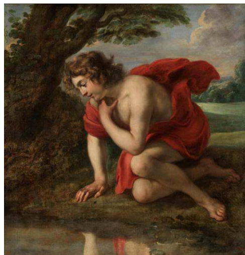
Jan Cossiers, Narciso, 1636-1638. Óleo sobre lienzo.

Las tres cártes —conocidas como gracias en Roma— eran hijas de Zeus y de la oceánide Eurínome. Integrantes del séquito de Apolo, a veces también acompañaban a Afrodita, Atenea, Eros o Dioniso. Simbolizaban la afabilidad, la simpatía y la delicadeza, y se asociaban con el amor, la belleza, la sexualidad y la fertilidad, como fuerzas generadoras de vida.