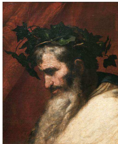
José de Ribera, Detalle de la cabeza del dios Baco , 1636. Óleo sobre lienzo.

Con la oceánide Metis concibió a Atenea, diosa de la guerra, pero también de la sabiduría, de la música y de la artesanía. De la relación de Zeus con Leto nacieron Artemisa y Apolo, diosa de la caza y dios de la luz, la belleza, la poesía y la música, respectivamente. Con su hermana Deméter engendró a Perséfone, que fue raptada y transportada al inframundo por su tío Hades. De su matrimonio con Hera, también hermana suya, nacieron Iliía, protectora de las parturientas; Hebe, personificación de la juventud, y Ares, dios de la guerra. Con la pléyade Maya tuvo a Hermes, el mensajero de los dioses, y con la mortal Semele a Dioniso, dios del vino y la fiesta. Algunos relatos dicen que también era hija suya Afrodita, la diosa del amor, que se casó con Vulcano, dios del fuego, a quien Hera había engendrado sin la participación de su esposo.